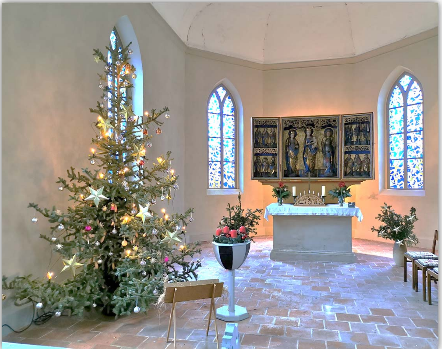
Heilig Abend 2019 in der Kirche Großbadegast

(Ausgabe für Großbadegast, Prosigk, Radegast/Zehbitz, Riesdorf und Weißandt-Gölzau)